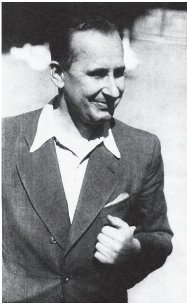
Otec v době zatčení