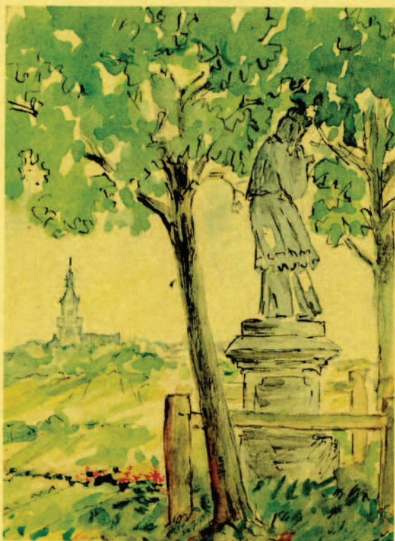
Pohled na Lanžhot od sochy sv. Jana v polích.

V očích máš stále chtivé jiskry, ty lucerničky pohádky, zahrádka zoubků svítí něhou kopretin vitých do řádky.